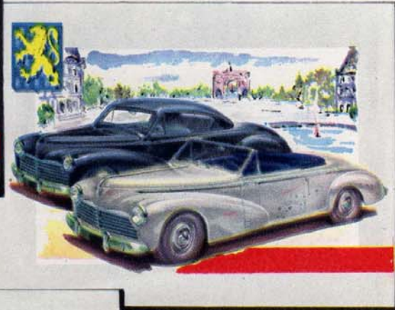
↑ COUPÉ « LUXE » 203 CABRIOLET « LUXE » 203