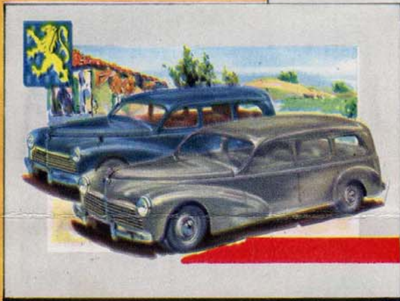
↑ COMMERCIALE 203-U C.U. 450 Kg. FAMILIALE 203-L