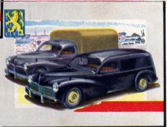
→ CAMIONNETTE 203-U C.U. 850 Kg. FOURGONNETTE 203-U C.U. 400 ou 600 Kg.

FOURGON D3A C.U. 1400 Kg. AMBULANCE 2 brancards CAR 14 places " FOURGON VITRINE " " FOURGON BOUTIQUE " (sur demande)