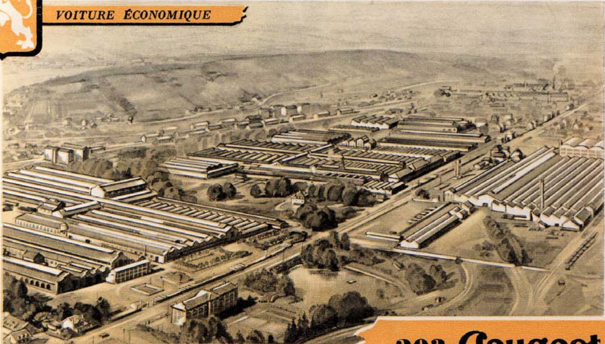
Le Centre de Production des Automobiles Peugeot à Sochaux - Montbéliard.